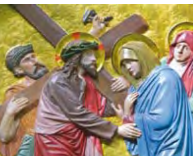
Vierte Station des Kreuzweges in Maria Martental, Eifel.

Gertraud gibt die Anregung, sich in der Fastenzeit für das gemeinsame Gebet des Kreuzweges einzusetzen. Wichtig ist ihr, dadurch in eine tiefe Beziehung zu Jesus Christus hineinzuwachsen. Dazu bedarf es „kein(es) stundenlange(n) Betens...“, ein liebendes Anschauen der Bilder genügt ja, wenn uns dadurch die Liebe unseres Heilandes immer bewusster wird!“