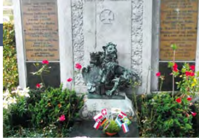
Grab in Kempten, Oktober 2014